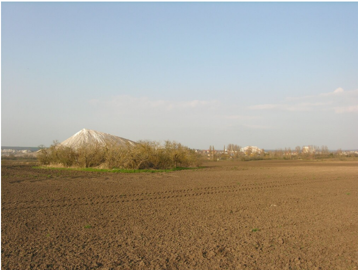
Revierhaus der Grube Martha (1853-1913) - das Grubenhaus Martha in der Gebüschgruppe gelegen; Blick N