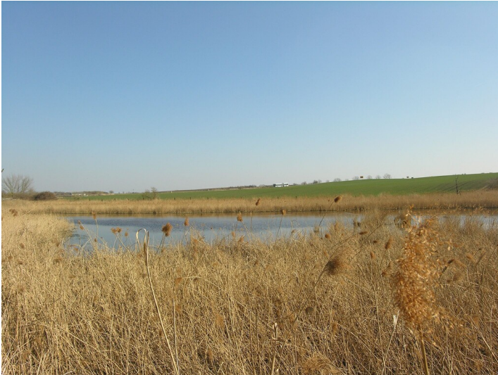
Bruchfeld der Grube Kleiner Wilhelm (1854-1895) - Bruchfeld Kleiner Wilhelm, Bildhintergrund, grünes Feld, rechts; Blick SE