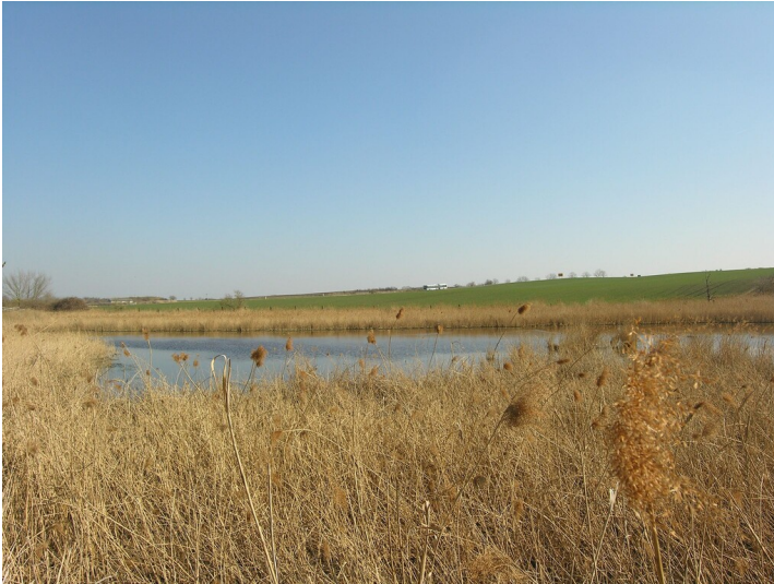
Bruchfeld der Grube Kleiner Wilhelm (1854-1895) - Bruchfeld Kleiner Wilhelm, Bildhintergrund, grünes Feld, rechts; Blick SE