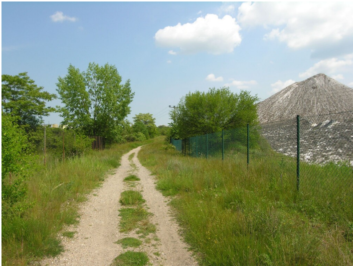
Weg von Wansleben nach Köchstedt (18. Jh.) - Der Köchstedter Weg, Richtung Osten