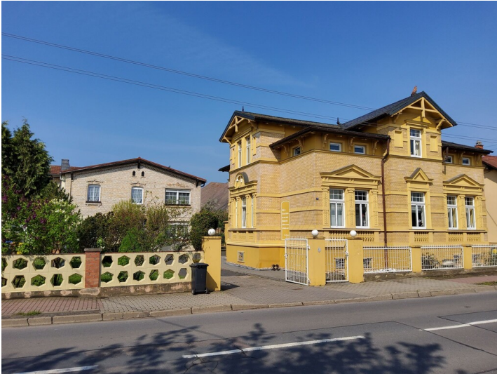
Faktorei Langenbogen - vermutliches Faktoreigebäude im Hintergrund