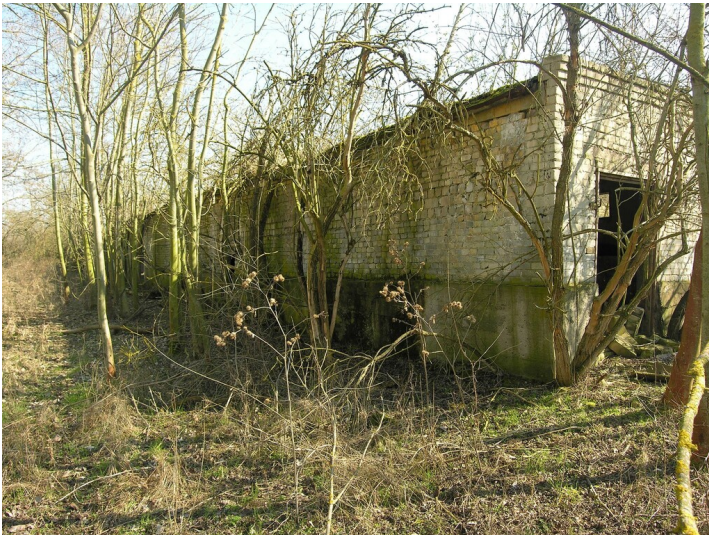
Schwelerei (1872-vor 1903) - ein Schweinestall (um 1980) im Bereich der ehemaligen Fabrik; Blick SE