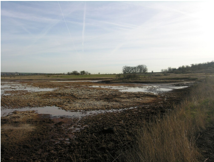
Friedhof der Siedlung Schachtberg (ca. 1806) - die Baumgruppe am Horizont kennzeichnet den Friedhof; Blick E