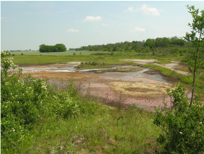
Siedlung Schachtberg (um 1806-ca. 1965) - Blick zur Schachtbergsiedlung und zum Friedhof, Bildhintergrund rechts und mittig; Blick E