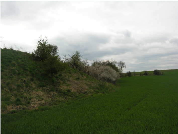
Kippe der Grube Seeberg (1882-1900) - an der östlichen Böschung der Kippe; Blick N

Schlagwörter: Abraumhalde Fachsicht(en): Denkmalpflege Gemeinde(n): Teutschenthal Kreis(e): Saalekreis Bundesland: Sachsen-Anhalt