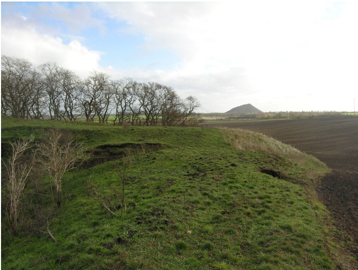
Tagesanlagen und Fabrik der Grube Seeberg (nach 1882-vor 1899) - vermutliches Relikt einer Aschehalde; Blick S