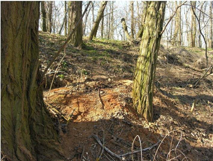
Aschehalde einer Schwelerei (1872-vor 1903) - Ascheaufschluss durch Fuchs- und Dachsbau; Blick N