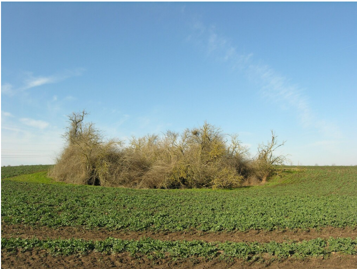
Schacht oder Tagebau (vor 1851) - Situation des Schachtes oder der Grube, in der Gebüschgruppe; Blick N