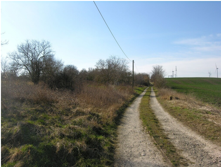
Abfallhalde einer Tiefbaugrube (nach 1860) - Situation in Nähe der Aschalde, im Gebüsch links; Blick W