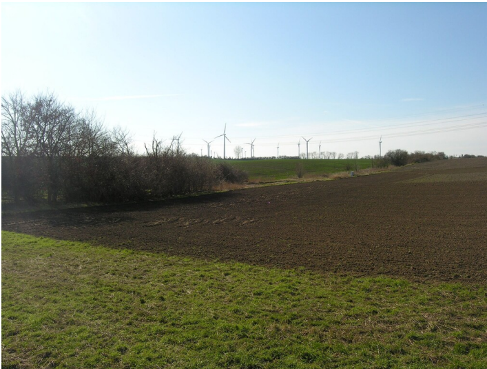
Schacht und Tagesanlagen der Grube Nr. 14 (vor 1800-1866) - Situation in Umgebung von Schacht Grube 14; Blick SW