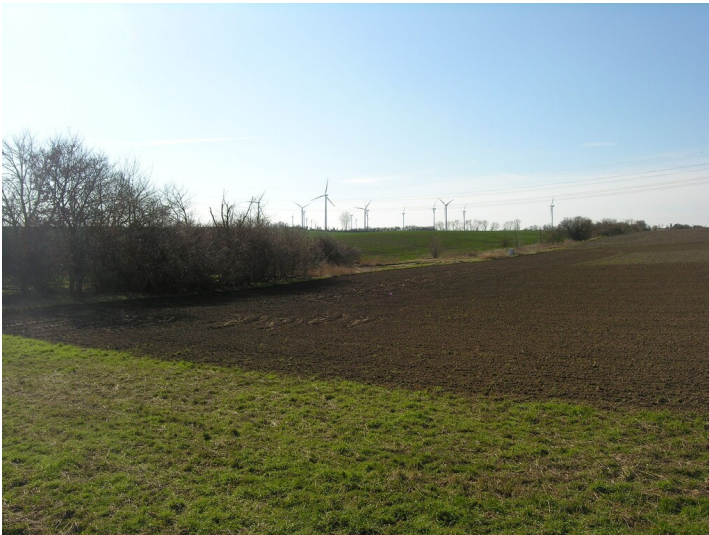
Schacht und Tagesanlagen der Grube Nr. 14 (vor 1800-1866) - Situation in Umgebung von Schacht Grube 14; Blick SW