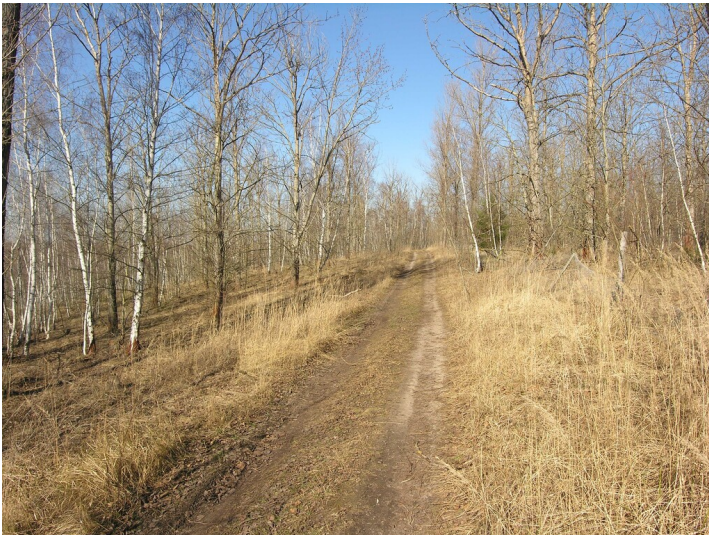
Außenkippe des Tagebau Merseburg-Ost (1971-1973) - auf dem aufgeforsteten Kippengelände; Blick N

Schlagwörter: Abraumhalde Fachsicht(en): Denkmalpflege Gemeinde(n): Schkopau Kreis(e): Saalekreis Bundesland: Sachsen-Anhalt