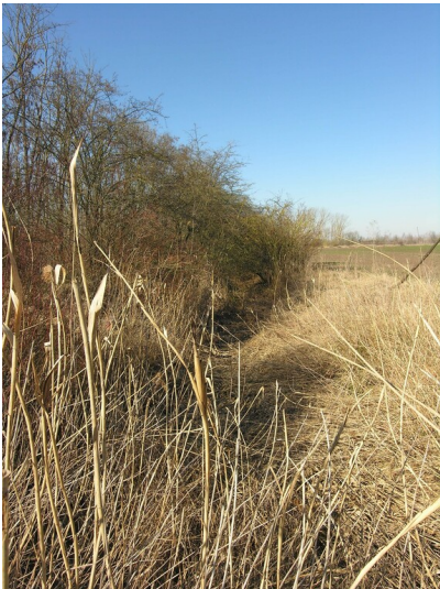
Verlegung eines Baches für den Tagebaus Lochau (ab 1928) - der verwachsene Graben, heute ohne Wasser; Blick W