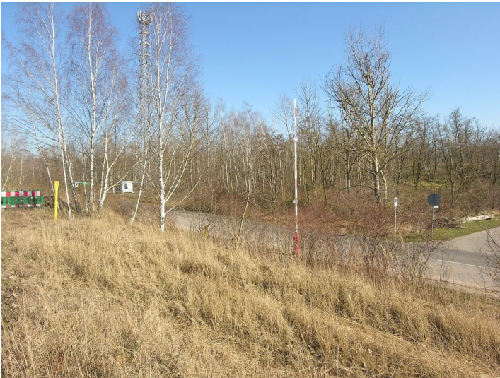
Tagebau der Grube Fortuna (1836-1847) - Situation der ehemaligen Grube Fortuna; Blick E