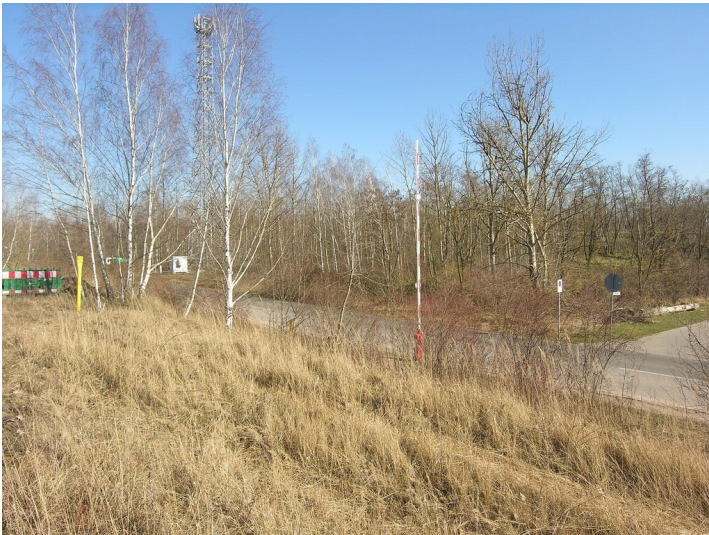
Tagebau der Grube Fortuna (1836-1847) - Situation der ehemaligen Grube Fortuna; Blick E

Schlagwörter: Tagebau Fachsicht(en): Denkmalpflege Gemeinde(n): Schkopau Kreis(e): Saalekreis Bundesland: Sachsen-Anhalt