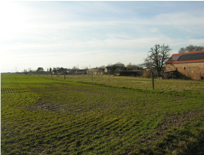
Bruchfelder der Grube Pauline (1859-nach 1912) - Abbaufeld am südlichen Ortsrand von Dörstewitz; Blick NW

Schlagwörter: Tagebau Fachsicht(en): Denkmalpflege Gemeinde(n): Schkopau Kreis(e): Saalekreis Bundesland: Sachsen-Anhalt