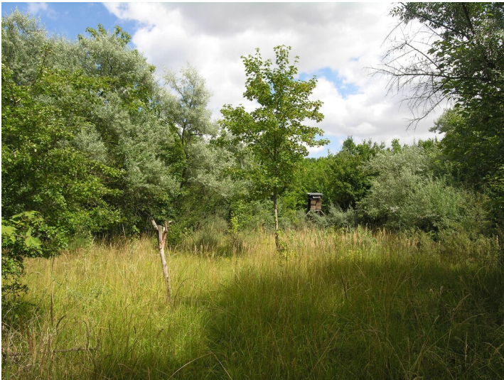
Schacht, Tagesanlagen und Fabrik der Grube 311 Pauline (1859-nach 1912) - über dem geplanten Fabrikgelände; Blick E