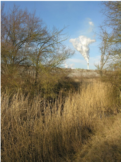
Spülhalde der BUNA-Werke (ab ca. 1950) - die Halde vom Laucha-Bach aus gesehen, in der Ferne der Schornstein des Kraftwerkes Schkopau; Blick NE