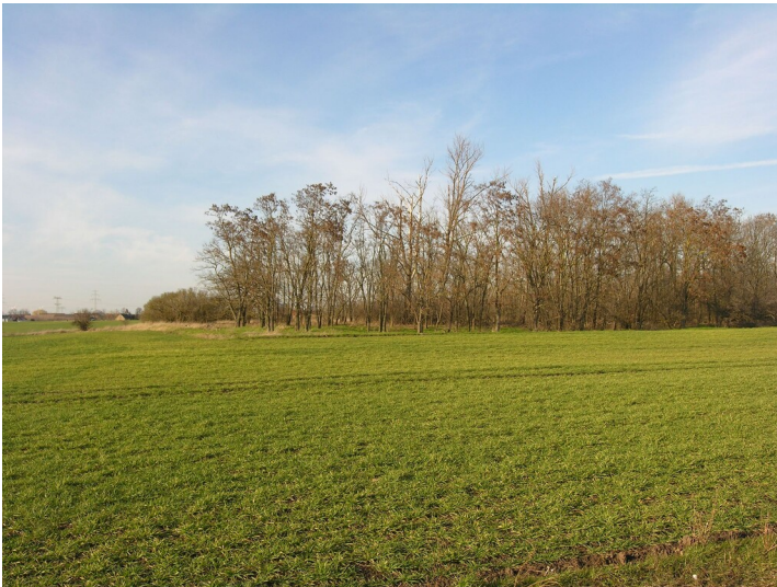
Schacht, Tagesanlagen und Fabrik der Grube Pauline vereinigt Feld (1881-1924) - das ehemalige Fabrikgelände hinter dem Waldstück links; Blick N