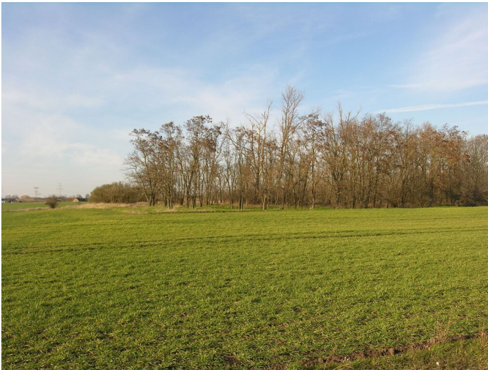
Schacht, Tagesanlagen und Fabrik der Grube Pauline vereinigt Feld (1881-1924) - das ehemalige Fabrikgelände hinter dem Waldstück links; Blick N