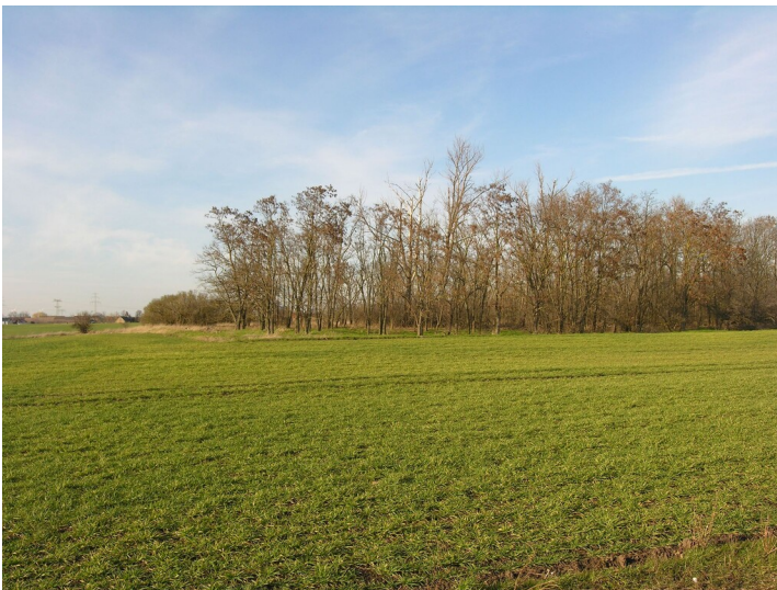
Schacht, Tagesanlagen und Fabrik der Grube Pauline vereinigt Feld (1881-1924) - das ehemalige Fabrikgelände hinter dem Waldstück links; Blick N