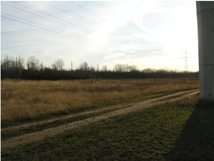
Tagebau der Grube Helene (1839-1842) - etwaige Situation der Grube Helene; Blick SW