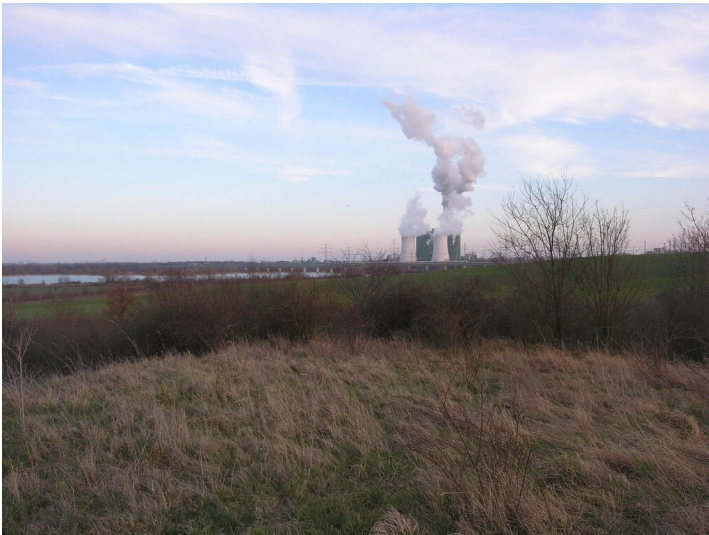
Tagebau am Fuchsberg (1816-1841) - im Gelände der späteren Kiesgrube; Blick SE