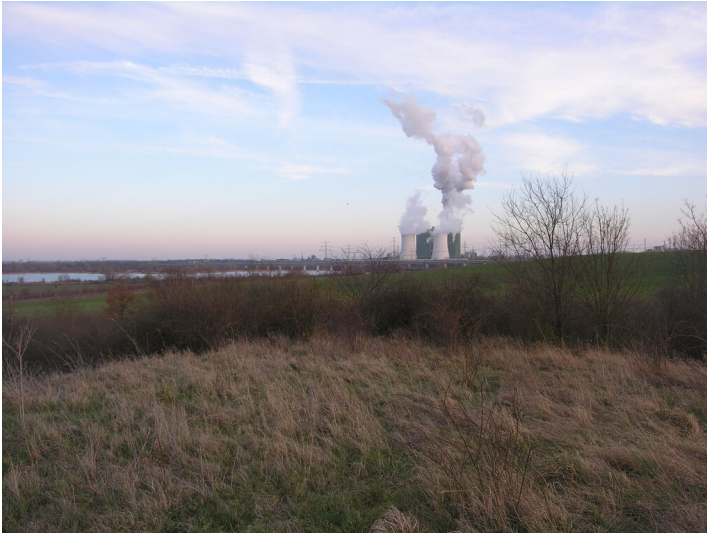
Tagebau am Fuchsberg (1816-1841) - im Gelände der späteren Kiesgrube; Blick SE