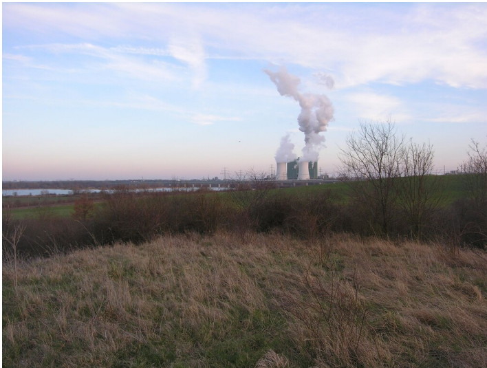
Tagebau am Fuchsberg (1816-1841) - im Gelände der späteren Kiesgrube; Blick SE