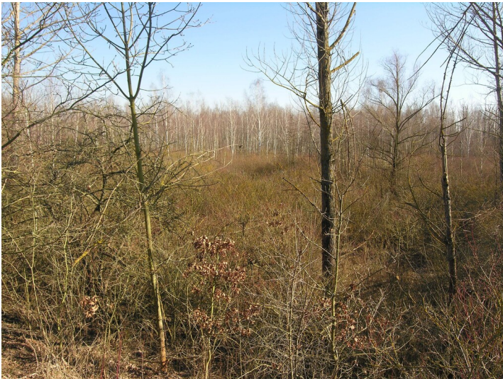
Tagebau Döllnitz (1930-1955) - verfüllter Tagebau; Blick E