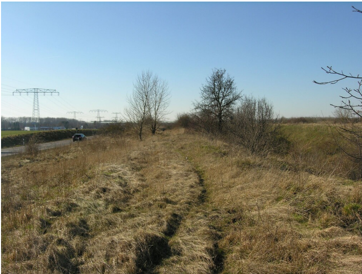
Feldbahn der Ziegelei Döllnitz (nach 1872-nach 1940) - Relikte des Bahndammes; Blick W