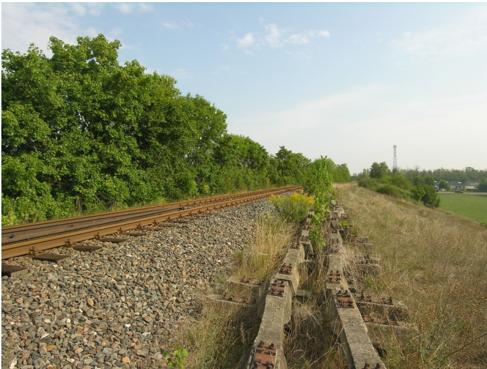
Erhöhter Eisenbahndamm in der Elsteraue (1928) - auf dem Bahndamm; Blick N