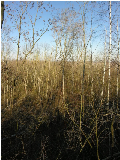
Schacht und Tagesanlagen der Grube Hermine Henriette II (1898-1925) - bewaldetes Gelände im Bereich der ehemaligen Schachtanlage; Blick von der Hochkippe nach Norden