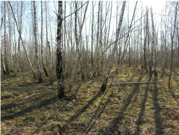
Hochkippe über der Grube Eintracht (vor 1940) - auf der Kippenoberseite; Blick SW

Schlagwörter: Abraumhalde Fachsicht(en): Denkmalpflege Gemeinde(n): Schkopau Kreis(e): Saalekreis Bundesland: Sachsen-Anhalt