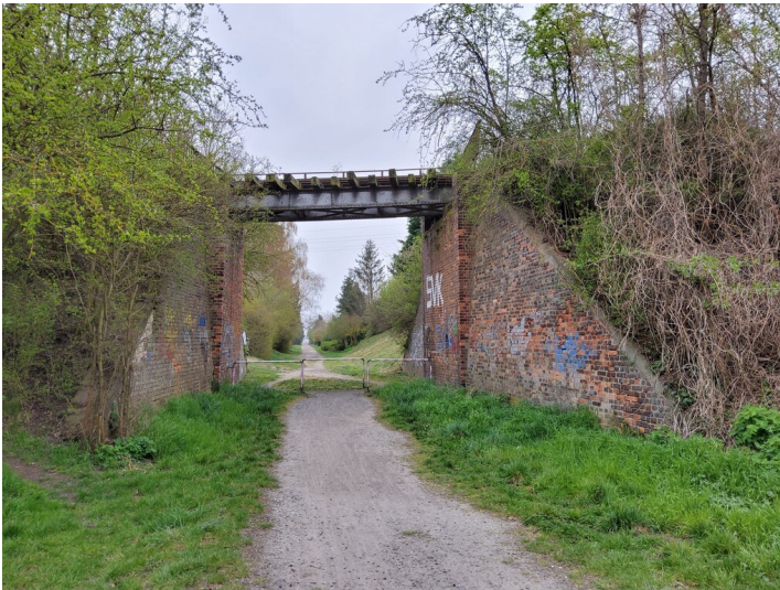
Brücke der Bahnstrecke Halle-Hettstedt - Blick nach Süden