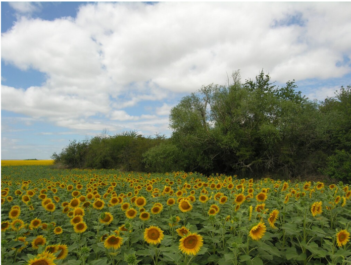
Schacht Neuer Fund (1859-1894) - Schachthalde; Blick NW