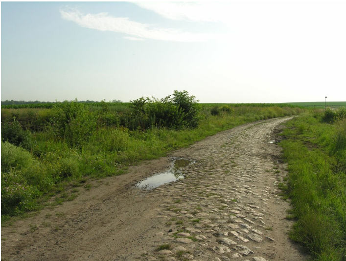
Werkstraße der Grube Eintracht (1850-1894) - die gepflasterte Straße zum Schacht; Blick E