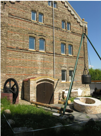
Schacht und Tagesanlagen der Grube Eintracht (1850-1894) - Gestaltung zum Thema Bergbau, im Ort Bennstedt; mit einem hierher umgesetzten Segment des gemauerten Schachtausbaus der Grube Eintracht; Blick SE