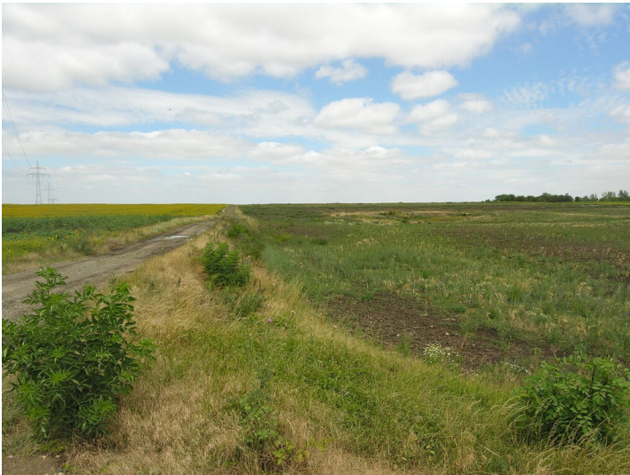
Abbaufelder zur Tongewinnung (um 1850) - über dem Abbaufeld, z.T. Grube Köllme; Blick N

Schlagwörter: Tagebau Fachsicht(en): Denkmalpflege Gemeinde(n): Salzatal Kreis(e): Saalekreis Bundesland: Sachsen-Anhalt