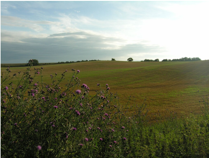
Schacht, Tagestrecken und Versuchsörter der Grube Sophie am Thierholz (1821-1832) - Situation ehemaliger Tagesanlagen der Grube Sophie am Thierholz; Blick E