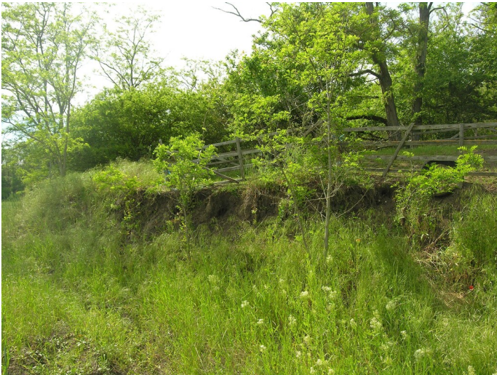
Abfallhalde eines Kalkofens (1850-vor 1938) - die Haldenböschung mit Erosionskante; Blick W