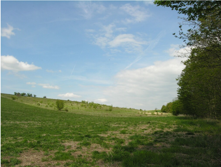
Vier Schächte mit Tagesanlagen (vor 1852-vor 1874) - Übersicht, Situation ehemaliger Schächte, am Wiesenhang; Blick NW