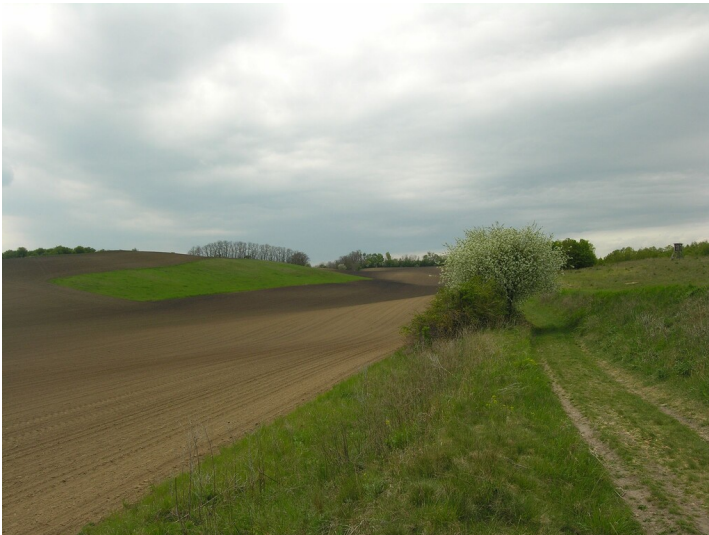
Fundgrube und Schacht der Grube Ferdinande - im Bereich der Fundgrube; Blick W