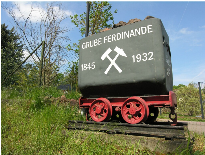
Erinnerungsort mit Grubenhunt - Grubenhunt als Erinnerungsort, vor dem Steigrehaus; Blick SE