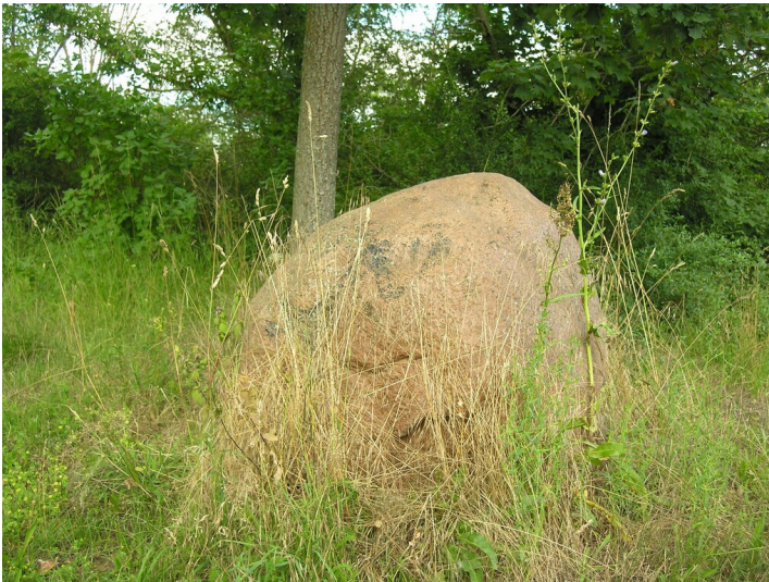
Tagebau Bruckdorf Süd - rekultivierte Innenkippe; Findling bei den Kleingärten; Blick E