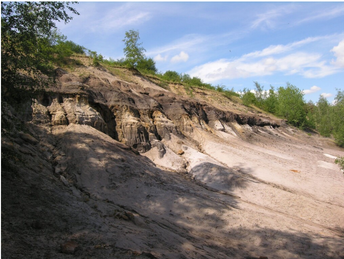
Geologischer Aufschluss am Fuchsberg - das geologische Profil an der nördlichen Tagebaukante, Kohleflöze; Blick NE