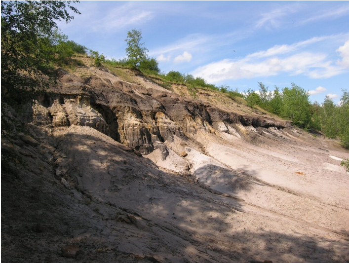
Geologischer Aufschluss am Fuchsberg - das geologische Profil an der nördlichen Tagebaukante, Kohleflöze; Blick NE