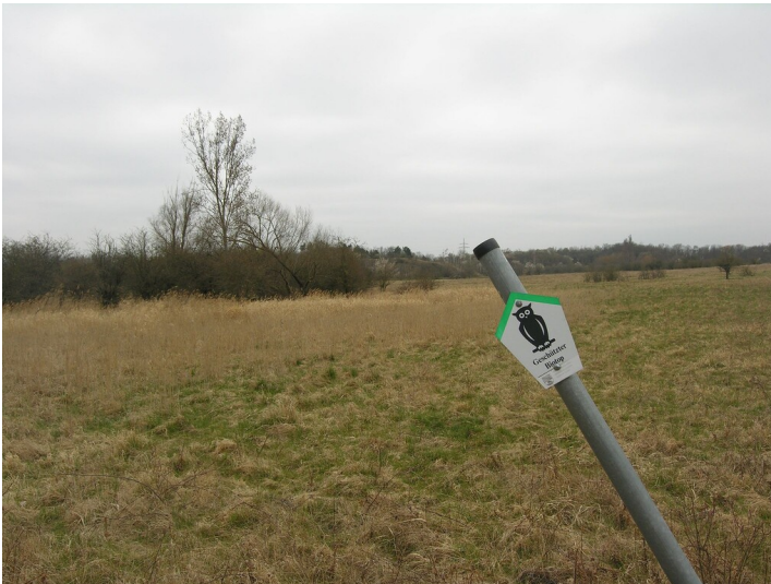
Verdachtsfläche eines Rohstoffabbaus - Situation des vermuteten Grubenfeldes, in der Wiesenenniederung; Blick SE