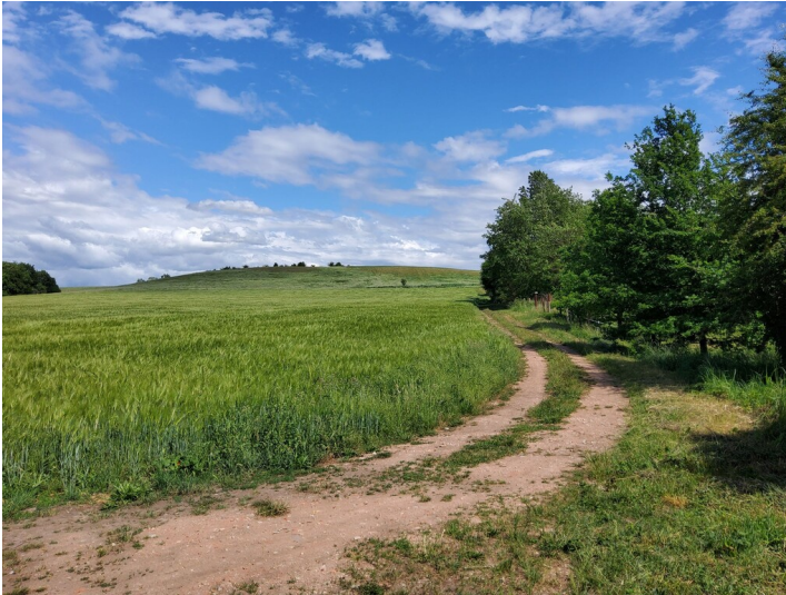
Grube Adolphine - Alte Zuwegung zur Tiefbaugrube Adolphine