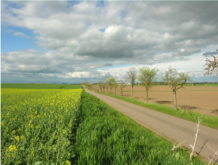
Bruchfeld der Grube Präsident - über den Bruchfeldern; Blick Nord