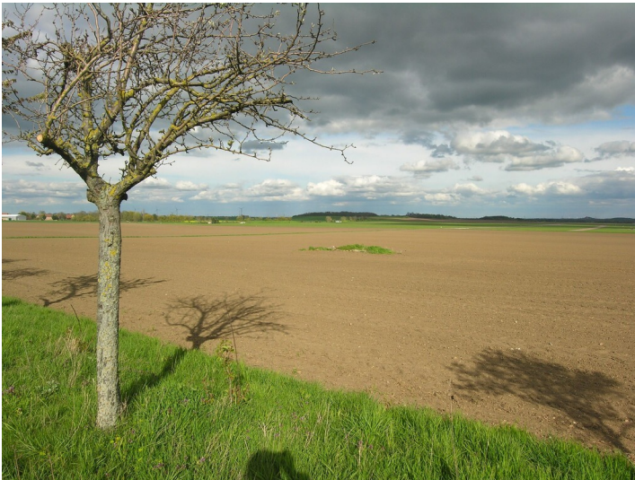
Schacht und Tagesanlagen der Grube Präsident - über den Bruchfeldern; Blick Nordost