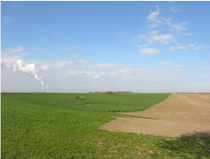
Luftschacht der Grube Clara Verein - der Lichtlochschant als buschbestandener Hügel im Feld, Horizont Mitte; Blick W