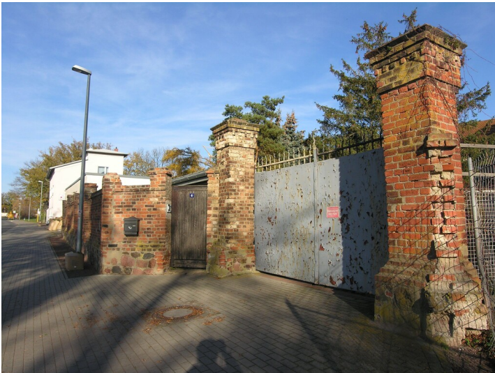
Zuckerfabrik Gröbers - Eingangsbereich zur Fabrik, mit Torsituation und Wirtschaftsgebäude; Blick NE