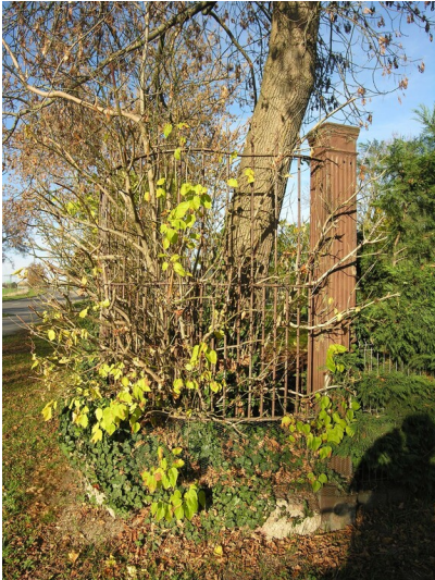
Zuckerfabrik Knauer - Zaun des Werksgarten; Blick N