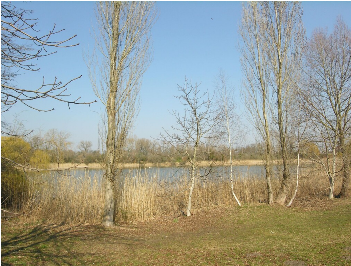
Tagebau der Grube Delbrück - das Tagebaurestloch; Blick N