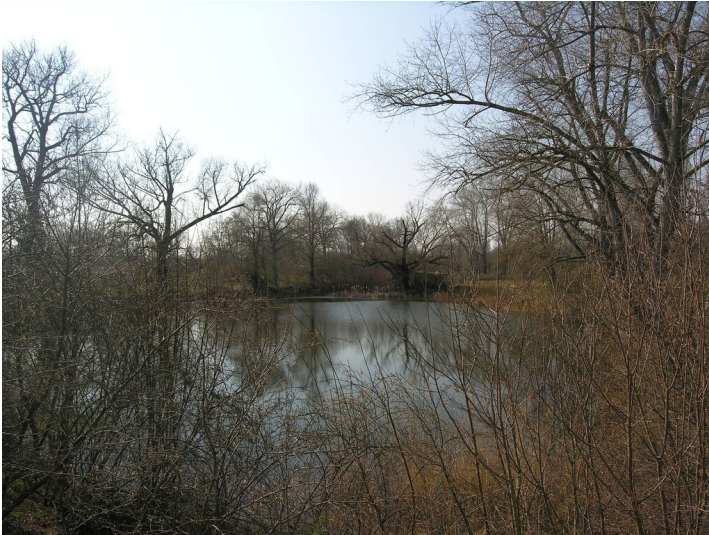
Bruchfeld des Rießer-Schachtes - Senkungsbereich über Bruchfeld; Blick W