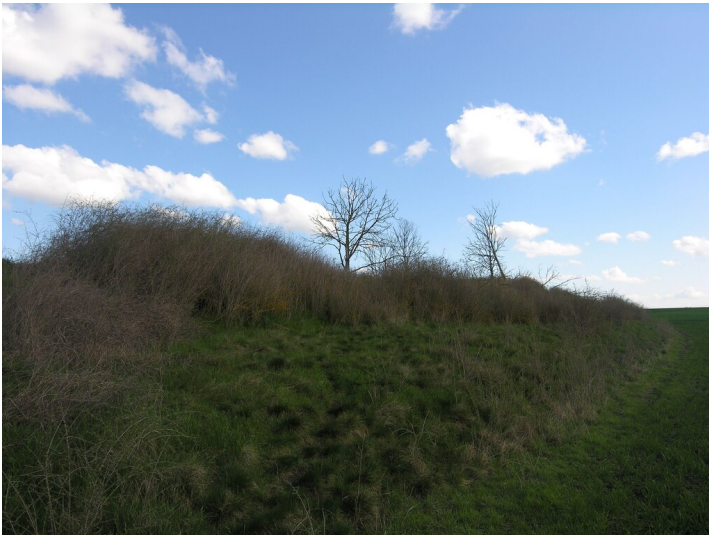
Aschehalde der Fabriken Grube Anna - die Aschehalde; Blick NE