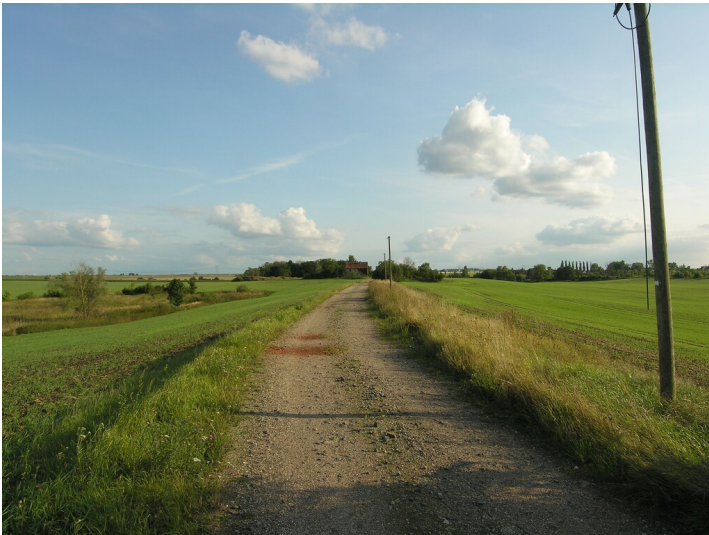
Schacht, Tagesanlagen und Fabrik der Grube Anna - Anfahrt zur Grube Anna, Werksstraße auf Sicherheitspfeiler, zu beiden Seiten davon auffällige Senkungen über Bruchfeldern; Blick Süd